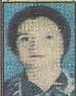
د/ نرمن صلاح استاذ طب الأطفال والسكر والقصد الصماء جامعة القاهرة