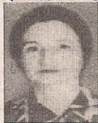
أ.د/ نرمين صلاح أستاذ طب الأطفال والسكر والغد الصماء، جامعة القاهرة