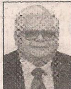
أ.د/ مجدى عمر أستاذ طب الأطفال والسكر والغد. جامعة الإسكندرية