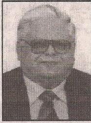
أ.د/ مجدى عمر أستاذ طب الأطفال والسكر، جامعة الإسكندرية