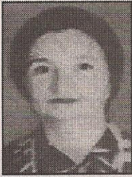
أ.د/ نرمين صلاح أستاذ طب الأطفال والسكر، جامعة القاهرة